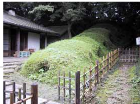
国史跡「御茶盃窯跡」