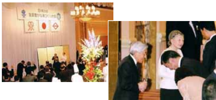
第25回大会(神奈川県)の様様