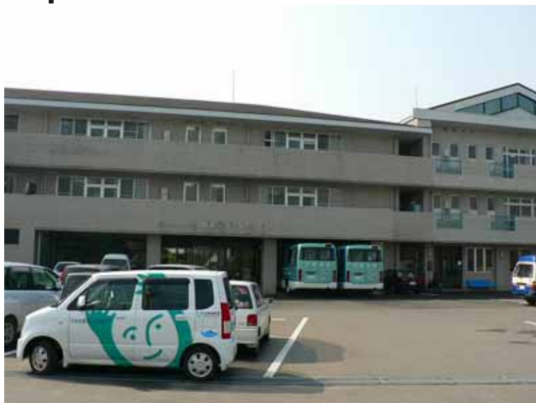
特別養護老人ホームつぼみ荘