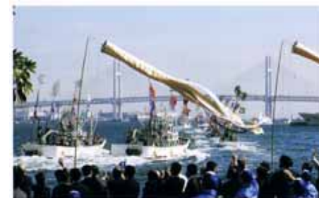
第25回大会(神奈川県)の様様