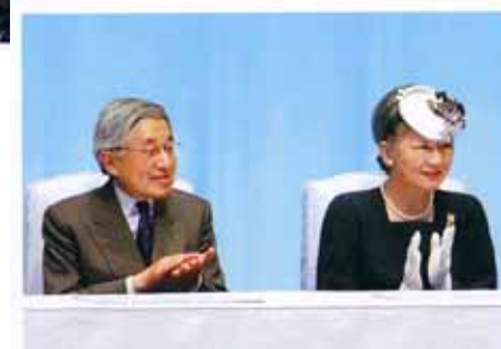
第25回大会（神奈川県）の様様