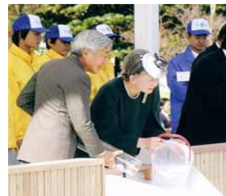
第25回大会(神奈川県)の様様